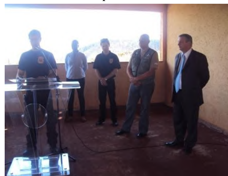
Outro importante momento foi a oficialização da parceria da Polícia Federal para ajudar na preservação do Parque Estadual da Serra do Rola Moça; Iniciativa que tem o apoio da Zeladoria do Planeta