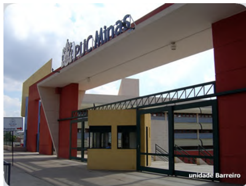
A ONG Zeladoria do Planeta parabeniza a PUC MINAS do Barreiro pelos seus 10 Anos de Atividades sustentáveis em prol da educação